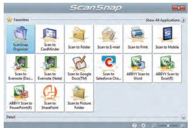
Menu rapide pour les fonctionnalités Mac OS et autres applications